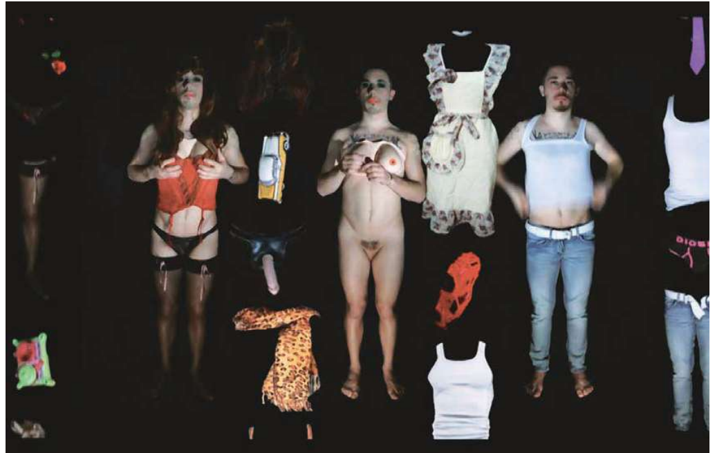
NOUS SOMMES TOUTES DES TRAVESTIES de Gérard Chauvin

L'humanité accorde des violons, des désirs, des corps, des images et des sons... C'est l'une des singularités qui la distingue des animaux et des plantes. En accordant, elle commet aussi des discordes, des raccords dans le mouvement au-delà des limites de son territoire. Elle transforme ce qu'elle touche et se transforme de ce qui la touche. Vivre ou créer, c'est entrer en transe, en un état second qui transgresse les disciplines artistiques ou les frontières en tout genre. Le corps humain est un inter-mutant du spectre de l'art et des cartographies politiques, qui outrepassa passionnément le mauvais genre quand il rejoint le genre humain mutant.